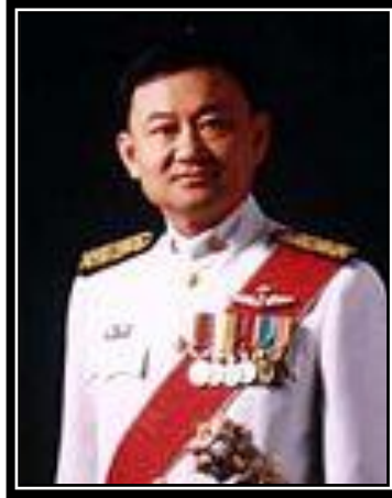
พันตำรวจโท ทักษิณ ชินวัตร นายกรัฐมนตรี