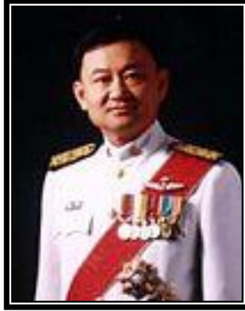
พันตำรวจโท ทักษิณ ชินวัตร นายกรัฐมนตรี