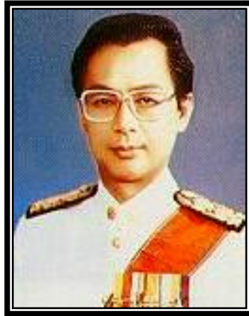
นายชวน หลีกภัย นายกรัฐมนตรี

สมัยรัฐบาล นายชวน หลีกภัย เป็นนายกรัฐมนตรี