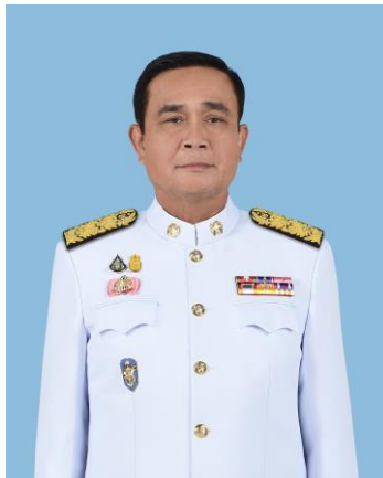
พลเอก ประยุทธ์ จันทร์โอชา