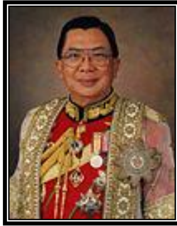
พลเอก ชวลิต ยงใจยุทธ นายกรัฐมนตรี