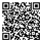
บันทึกการประชุมสภา สำนักแรงงาน การประชุมและชวเลข