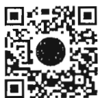
หนังสือนัดประชุม และระเบียบวาระการประชุม สภาผู้แทนราษฎร

การนัดประชุมได้แจ้งให้สมาชิกทราบทางสื่ออิเล็กทรอนิกส์เรียบร้อยแล้ว และท่านสมาชิกสามารถอ่านเอกสารประกอบการประชุมสภาผู้แทนราษฎรได้ โดยการสแกน QR Code หรือทาง www.parliament.go.th