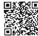
เอกสารประกอบ การพิจารณา สำนักวิชาการ