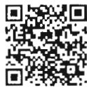
บันทึกการประชุมสภา สำนักrayงาน การประชุมและตัวเลข