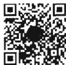
กระทู้ถามสด ด้วยวาจา