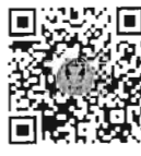
กระตุกถามสด ด้วยวาจา