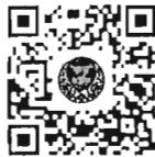
หนังสือนัดประชุม และระเบียบวาระการประชุม สภาผู้แทนราษฎร

การนัดประชุมได้แจ้งให้สมาชิกทราบทางสื่ออิเล็กทรอนิกส์เรียบร้อยแล้ว และท่านสมาชิกสามารถอ่านเอกสารประกอบการประชุมสภาผู้แทนราษฎรได้ โดยการสแกน QR Code หรือทาง www.parliament.go.th