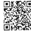
เอกสารประกอบ การพิจารณา สำนักวิชาการ